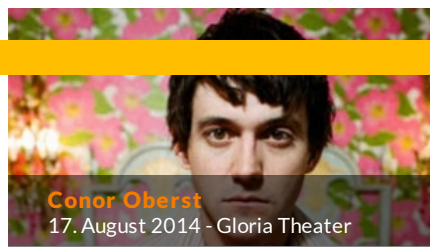
Conor Oberst 17. August 2014 - Gloria Theater